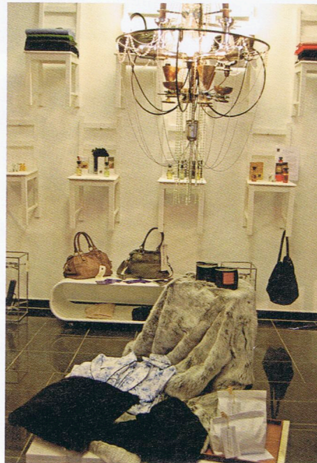
Von Fellkissen bis zu Handtaschen reicht das Sortiment im Bereich Home Fashion bei Simon und Renoldi.

Klassische Designer-Möbelstücke wie z.B. Eams Chair oder ein Arne Jacobsen-Ei sowie Fellkissen oder Kerzen von True Grace sind im Bereich Home Fashion vertreten. Besonders gut laufen auch Tablett von Ebride aus Frankreich sowie spezielle Blumenübertöpfe, die mit kleinen Figürchen versehen sind, wie beispielsweise von Charles & Marie. «Beson-